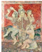
SAKTI BURMAN (1935) Estimé : 15000/20000€ ADJUGÉ 15.000€