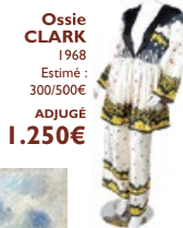
Ossie CLARK 1968 Estimé : 300/500€ ADJUGÉ 1.250€