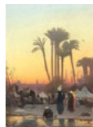
ECOLE ORIENTALISTE Estimé : 50/80€ ADJUGÉ 7.500€