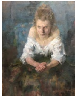
OLGA BOZNANSKA (1865-1940) « Femme à la blouse blanche », 1905, Estimé : 10000/12000 ADJUGÉ 84.000€