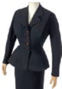
CHRISTIAN DIOR Estimé : 3000/5000€ ADJUGÉ 5.000€