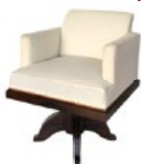
JACQUES EMILE RUHLMANN Estimé : 2000/3000€ ADJUGÉ 6.100€