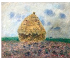
GUSTAVE LOISEAU (1865-1935) Estimé : 15000/20000€ ADJUGÉ 15.000€