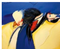
JAN MEYER Estimé : 800/1200€ ADJUGÉ 3.000€