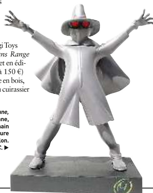
Statuette La marque jaune , signée Leblon-Delienne, produite et peinte à la main à partir d'une sculpture originale de Marie Leblon. Estimée 400 à 600 €. ►

► Mardi 18 septembre, à 14 h 15 à l'hôtel des ventes, 77 rue Cauchoix. Expositions le 17, de 10 h à 12 h et de 14 h à 17 h 30, et le 15, de 11 h à 17 h. Régis. Tél. 01 34 05 00 77.