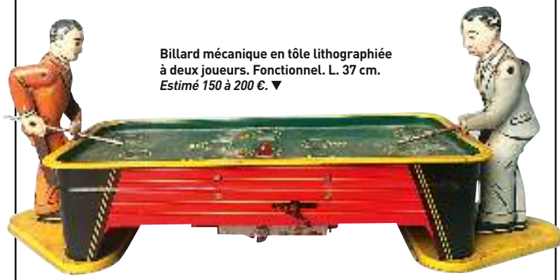
Billard mécanique en tôle lithographiée à deux joueurs. Fonctionnel. L. 37 cm. Estimé 150 à 200 €. ▼

► Lundi 17 septembre, à 14 h 30 à l'hôtel des ventes, 13 rue Paul Cabet. Exposition le 17, de 10 h à 12 h. Sadde. Tél. 03 80 68 46 80.